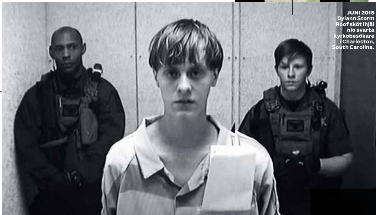
JUNI 2015 Dylann Storm Roof sköt ihjäl nio svarta kyrkobesökare i Charleston, South Carolina.

Att gärningsmännen så ofta för en isolerad tillvaro gör det svårt att identifiera varningstecknen.